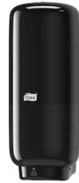
Tork Skincare Disp -Intuition sensor BI 561608