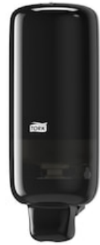
Tork Foam Soap Dispenser Black 561508