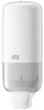
Tork Foam Soap Dispenser White 561500