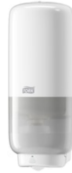
Tork Skincare Disp -Intuition sensor Wh 561600