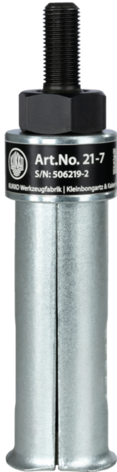
IMAGE DE CANDIDATURE