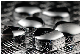
Embout en acier