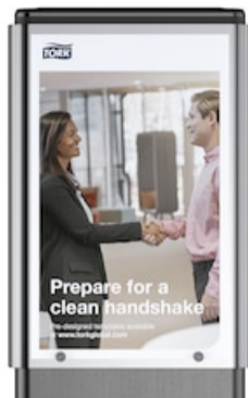
AD-A-Glance for Tork Hygiene Stand 511054