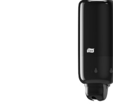
Tork Liquid and Spray Soap Dispenser BI 560008