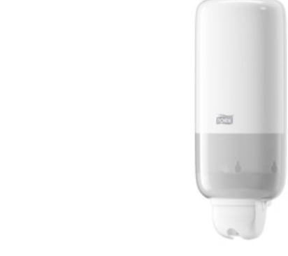
Tork Liquid and Spray Soap Dispenser Wh 560000