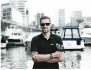
RVS met RVS verschroeven!