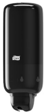
Tork Liquid and Spray Soap Dispenser BI 560008