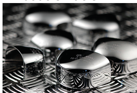
Embout en acier