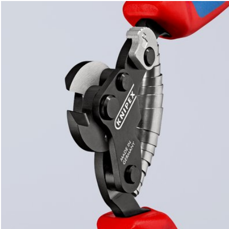
Scharnier met dubbel lager