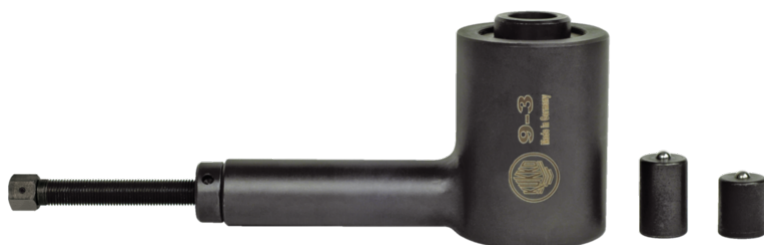
IMAGE DE CANDIDATURE