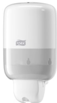
Tork Mini Liquid Soap Dispenser White 561000