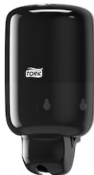
Tork Mini Liquid Soap Dispenser Black 561008