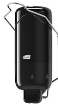
Tork Liquid Soap Dispenser -Arm Lever BI 560108