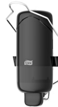
Tork liquid soap disp w bracket, Black 560109