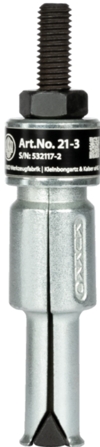
IMAGE DE CANDIDATURE