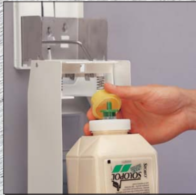
Dop van softfles verwijderen