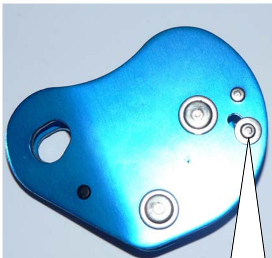
DETROMPEUR STOPFOR KSM