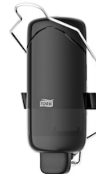
Tork liquid soap disp w bracket, Black 560109