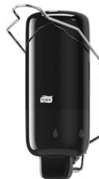
Tork Liquid Soap Dispenser -Arm Lever BI 560108