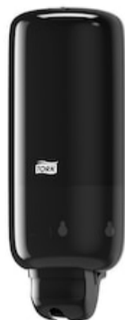
Tork Liquid and Spray Soap Dispenser BI 560008