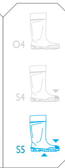
Steplite® noir - réf. P2400/8080