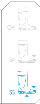
Agrilite® verte - réf. P2400/9180