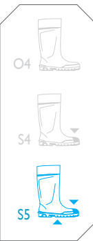
Steplite® jaune - réf. P2400/2080