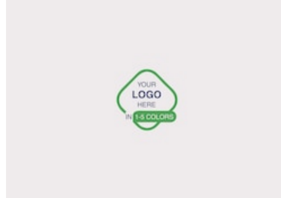
Tork Placemat 1P Wh 1-2c 12TRP 500 /5 479880