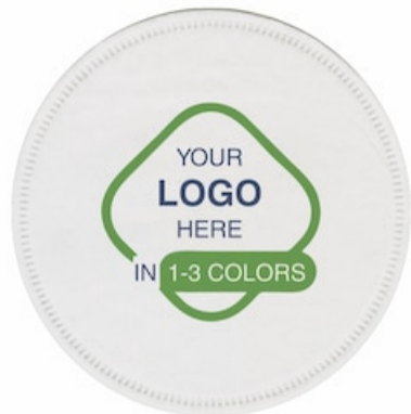
C9/8 round Tork cream 1-3c 12x250 479430