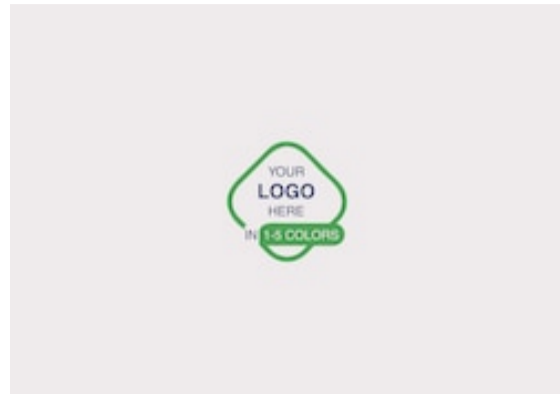
Tork Placemat 1P Wh 1-2c 6TRP 500 /5 479878