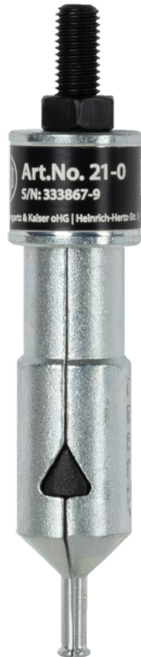
IMAGE DE CANDIDATURE