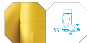
Aussi disponible en jaune réf. P2400/2080 (S5)