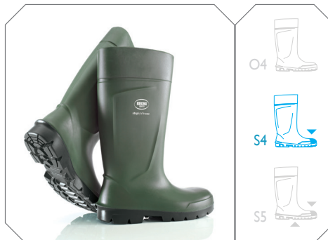
Steplite® Food verte - réf. P2300/9180