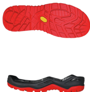
Semelle à crampons à deux couches VIBRAM® avec technologie Monowrap®