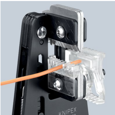
12 12 02 avec guidage du câble et butée longitudinale