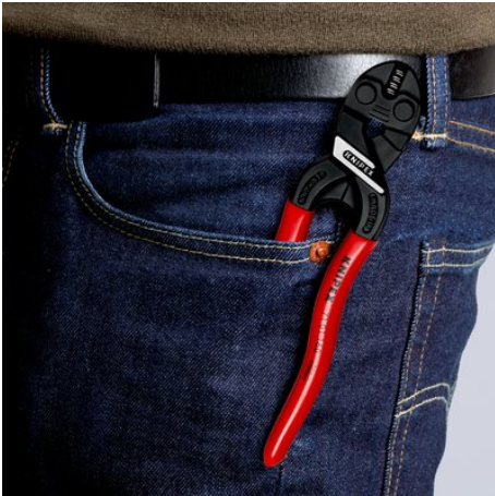
Compact, léger et toujours à portée de main