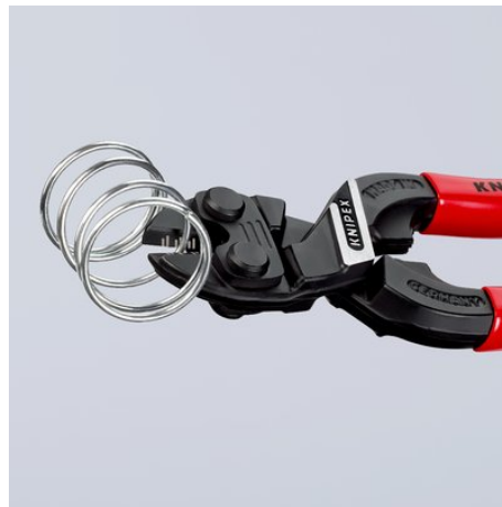
Tête étroite pour une accessibilité optimale