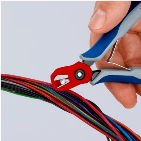
...het afgesneden gedeelte zit veilig in de materiaalvanger