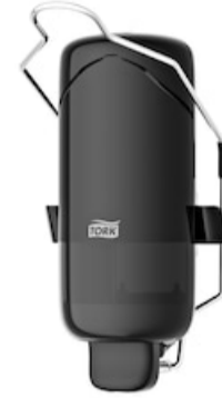
Tork liquid soap disp w bracket, Black 560109