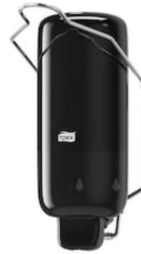
Tork Liquid Soap Dispenser -Arm Lever BI 560108