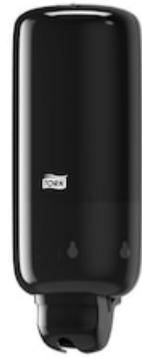
Tork Liquid and Spray Soap Dispenser BI 560008