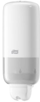
Tork Liquid and Spray Soap Dispenser Wh 560000